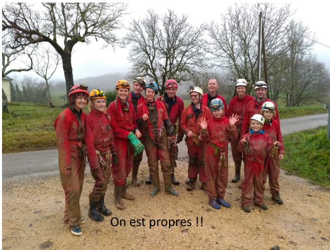
On est propres !!

Hé oui après les joies de la découverte il faut nettoyer le matériel.