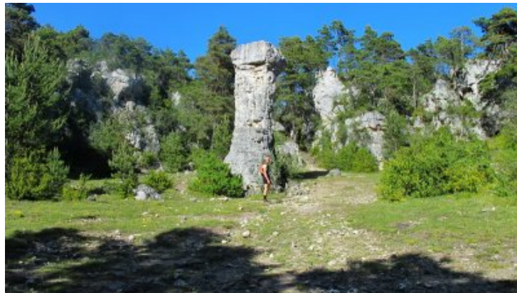
La balade des arcs de Saint-Pierre.