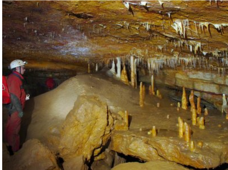
Dans un coin de la première grande salle.