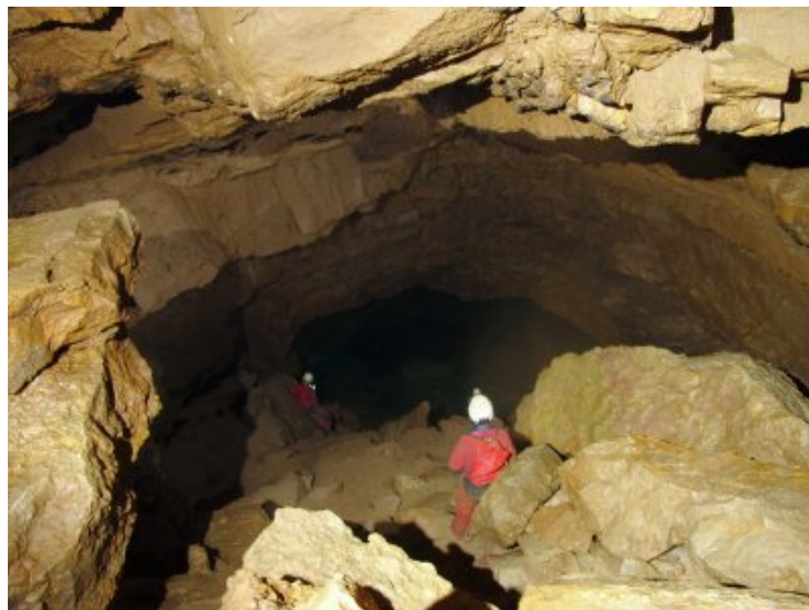
En descendant vers la deuxième grande salle.