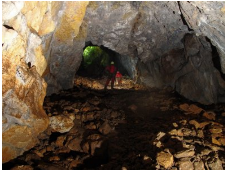
Le plan incliné.