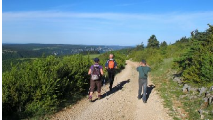
au dessus des gorges de la Jonte.