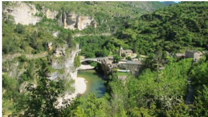
En quittant Saint-Chély du tarn.